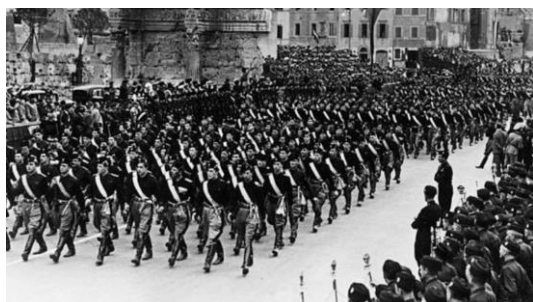
Marcha sobre Roma – Benito Mussolini.

Uma mistura legal de ambição, medo e cálculos equivocados conspirou para levá-las ao mesmo erro: ENTREGAR CONDESCENDENTEMENTE AS CHAVES DO PODER A UM AUTOCRATA EM CONSTRUÇÃO.