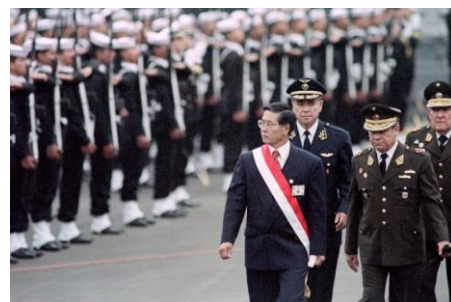
Ascensão de Alberto Fujimori – Peru.