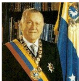
Rafael Caldera – Presidente da Venezuela

O flerte público de Caldera com Chávez fez mais do que impulsionar a posição de Caldera nas pesquisas; também deu nova credibilidade a Chávez. Chávez e seus camaradas tinham tentado destruir a democracia de 34 anos de seu país. Porém, em vez de denunciar os líderes do golpe como uma ameaça extremista, o ex-presidente ofereceu a eles a sua solidariedade pública - e, com ela, uma abertura para a política convencional.